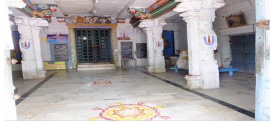
அர்த்த மண்டபத் தூண்கள்