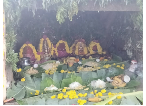
காட்டேரி அம்மன் வழிபாடு