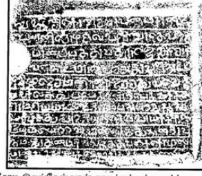
சோழ இலங்கேஸ்வரன் காலத்துக் கந்தனாபக் சாசனம்