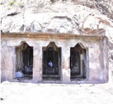
மாமண்டூர் குடைவரைக் கோயில் எண்பட்டை வடிவத் தூண்கள்

சமூக வகிபாகம் அடுத்தத் தலைமுறை ஆய்வாளர்களுக்கு மேலாய்வுக்களமாக உள்ளது.