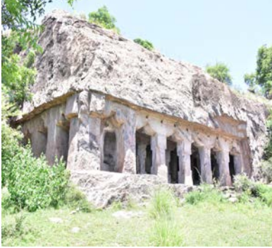
மாமண்டூர் குடைவரைக்கோயில் முற்றுபெறாத தூண்கள்